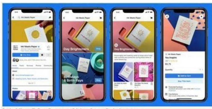
Facebook Shops will allow sellers to create digital storefronts on Facebook or Instagram

“Facebook Shops” consentirà ai venditori di creare vetrine digitali su Facebook o Instagram.